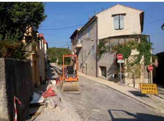
Croisement rue du Jaillet / rue des Marseillais

Ainsi, les travaux de réhabilitation de la rue du Jaillet sont en cours depuis plusieurs semaines. Ils concernent la rénovation de tous les réseaux secs et humides ainsi que la pose d'un caniveau central et d'un nouveau revêtement. Dans sa partie sud, avant le croisement avec le CD908, une mur de soutènement a été créé. Il permet de conforter la rue du Jaillet, qui surplombe un chemin privé à cet endroit. Le mur sera habillé d'un parement en pierre sèche pour l'embellir et mieux l'intégrer dans le bâti du village.