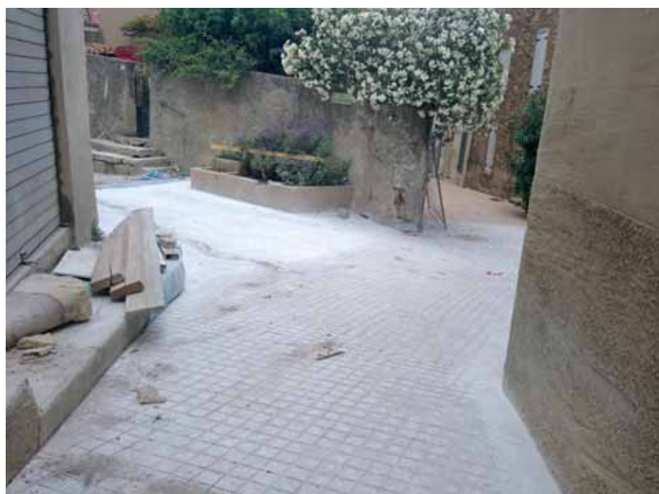
Nouveau pavage à l'angle des rues des Remparts et de l'Eglise