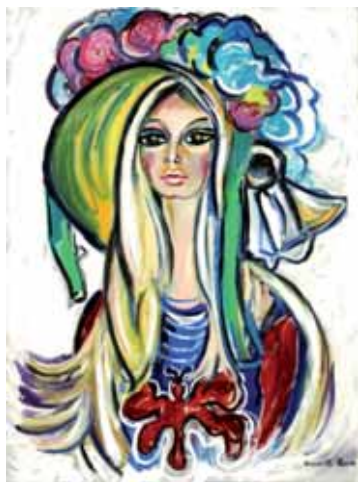
B. Bardot (Huile sur toile, 1970)