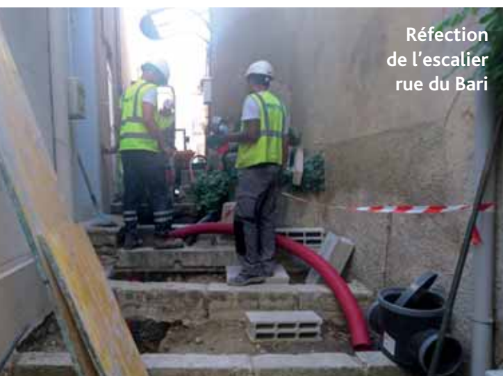
Réfection de l'escalier rue du Bari