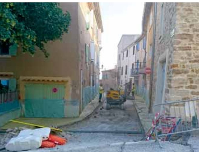
Réfection du pavage de la rue des Ormeaux