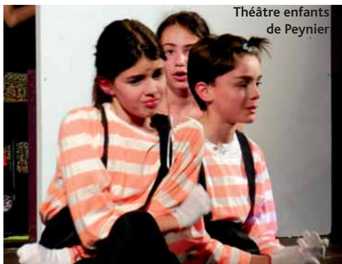
Théâtre enfants de Peynier

Les nombreux spectateurs présents ont pu assister à des représentations dignes de professionnels :