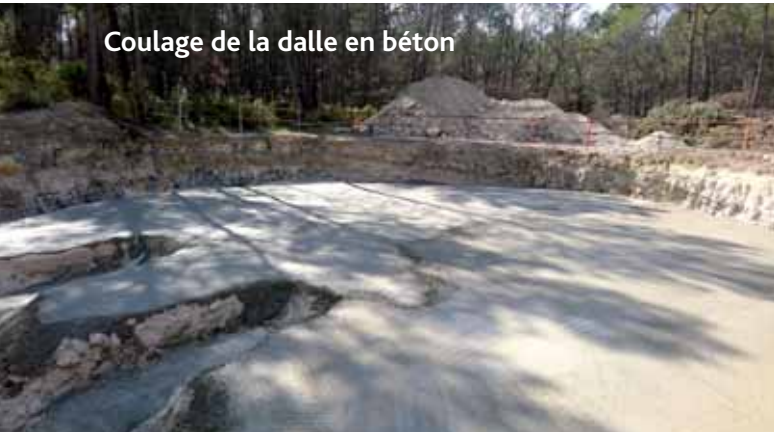
Coulage de la dalle en béton

Contenance : 800 m 3 Diamètre 16,80 m Hauteur : 5,3 m 2 compartiments Volume Béton : 250 m 3 Volume acier : 250 000 kg