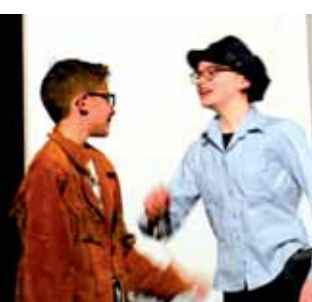
Théâtre ados de Peynier

Un seul souhait que la 8 ème édition soit encore meilleure !