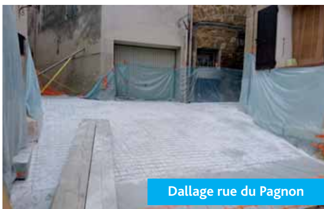
Dallage rue du Pagnon

Petit à petit, les rues et ruelles historiques du village retrouvent leur charme d'antan.