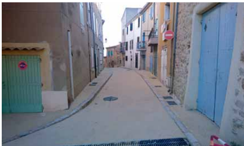
Rue des Ormeaux : le sol en béton désactivé est posé