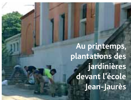
Au printemps, plantations des jardinières devant l'école Jean-Jaurès