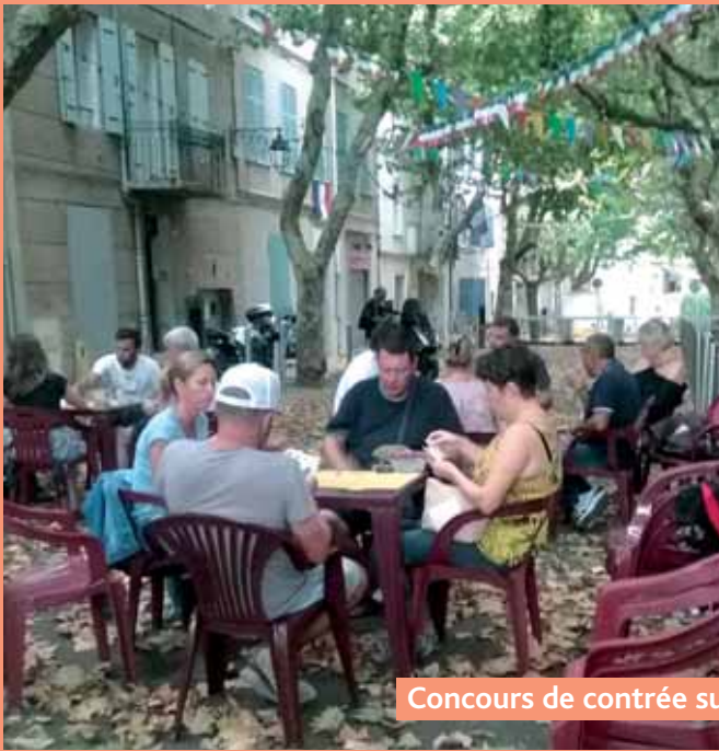
Concours de contrée sur le Cours et au boulodrome