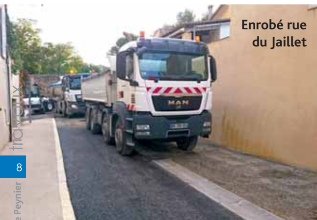
Enrobé rue du Jaillet