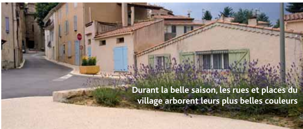
Durant la belle saison, les rues et places du village arborent leurs plus belles couleurs