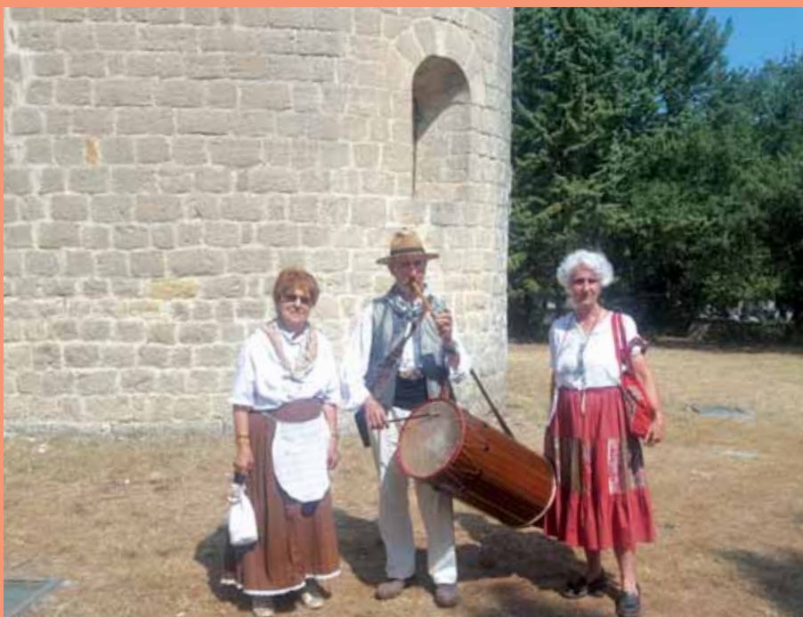
Tradition et convivialité lors de la messe célébrée en la chapelle Saint-Pierre