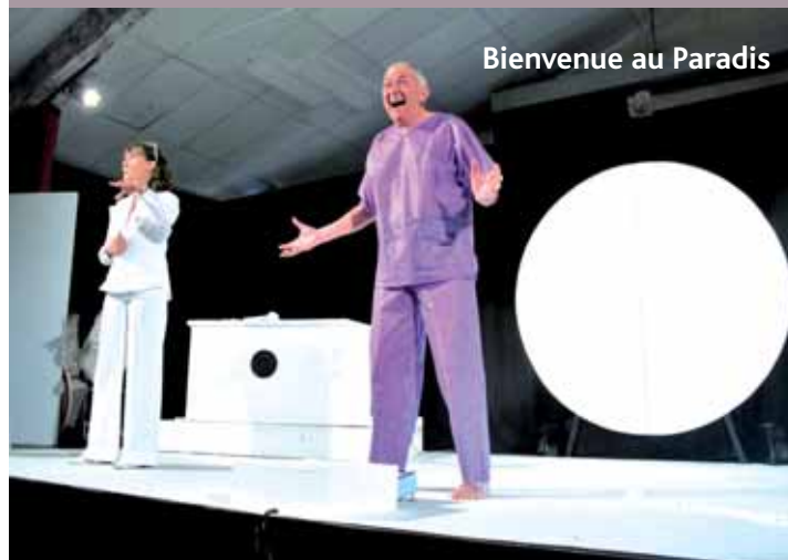
Bienvenue au Paradis