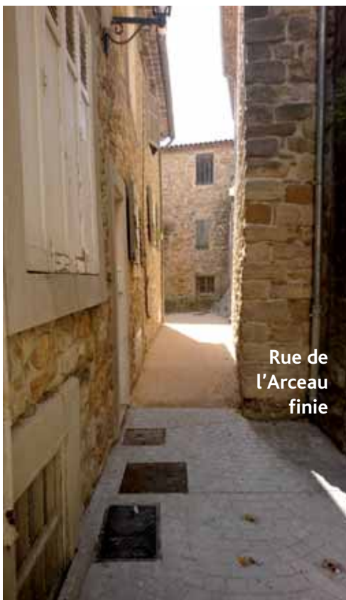
Rue de l'Arceau finie