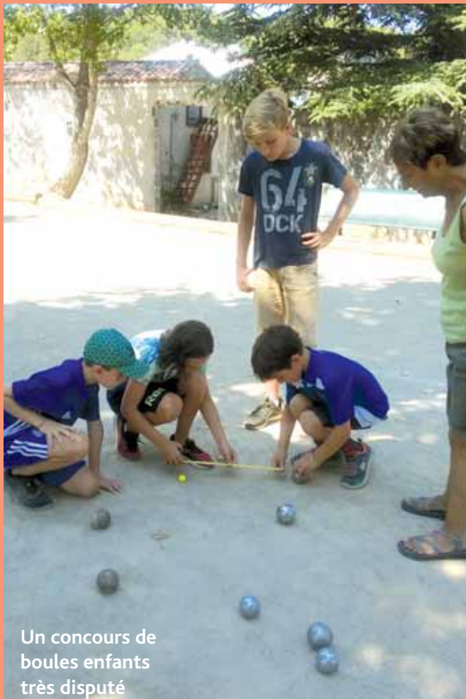
Un concours de boules enfants très disputé