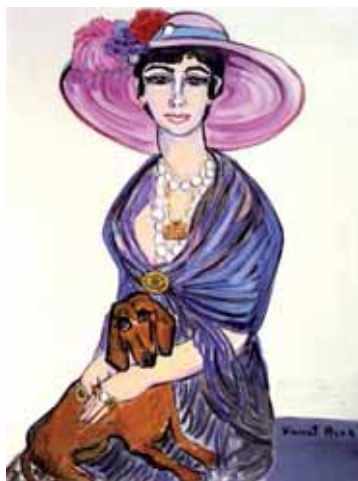
H. Caral de Montéty (Huile sur toile, 1975) Collection particulière

L'exposition a permis de faire partager au public un ensemble d'œuvres inédites représentatives des différentes périodes de l'artiste, mettant en relief la variété de ses sources d'inspiration, de ses techniques et des sujets traités. Avec les œuvres étaient présentées des photographies de Jean & Jean-Eric Ely qui donnaient à voir l'artiste dans son univers, à Aix-en-Provence et dans son atelier à Peynier. Cette exposition a eu lieu à l'Hôtel de ville et au Centre Socio-Culturel de la ville.