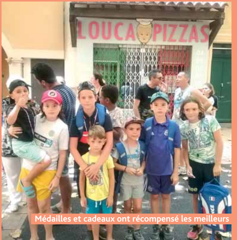
Médailles et cadeaux ont récompensé les meilleurs

La tradition n'était pas oubliée avec la messe du dimanche célébrée en la chapelle Saint-Pierre.