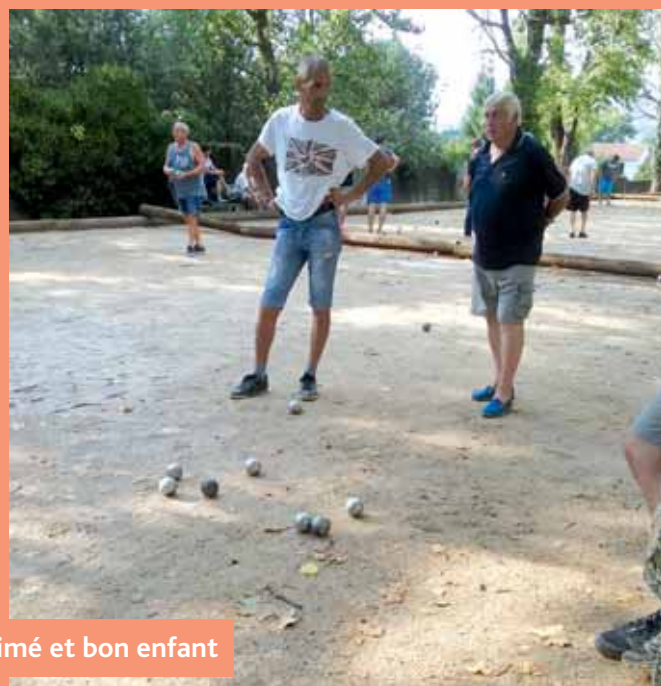
Un concours de jeu provençal animé et bon enfant