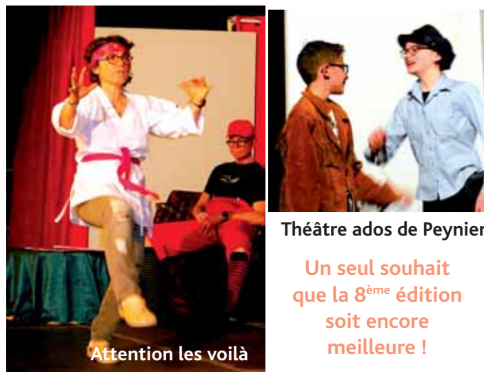
Attention les voilà

L'équipe du Foyer Rural tient à remercier tous les bénévoles, toutes les compagnies, la Mairie de Peynier, les services techniques et les cuisines toujours présents, Arc images pour les photos, M. Michel Aubertin pour les affiches et M. Laurent Patenta pour la régie. Rien n'aurait été possible sans l'engagement de toutes ces bonnes volontés.