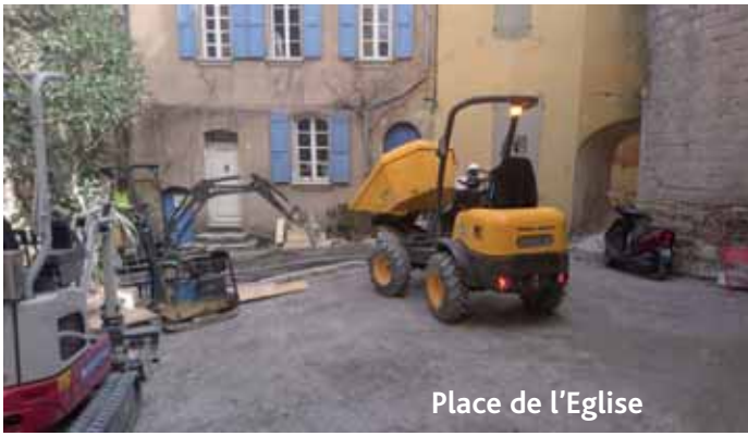
Place de l'Eglise

Le béton est coulé, les ouvriers réalisent les pochoirs imitant un dallage en éventail