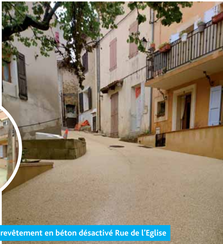
Pose de revêtement en béton désactivé Rue de l'Eglise