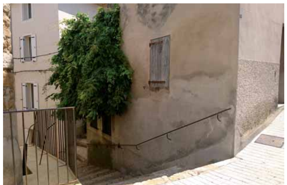
Pose d'une rampe de sécurité rue de l'Olympe