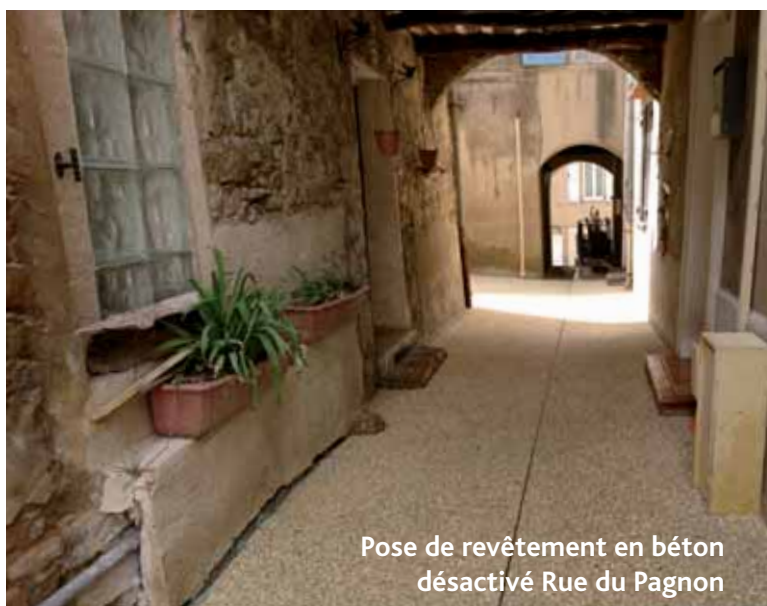
Pose de revêtement en béton désactivé Rue du Pagnon