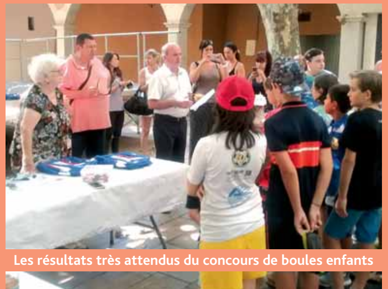
Les résultats très attendus du concours de boules enfants