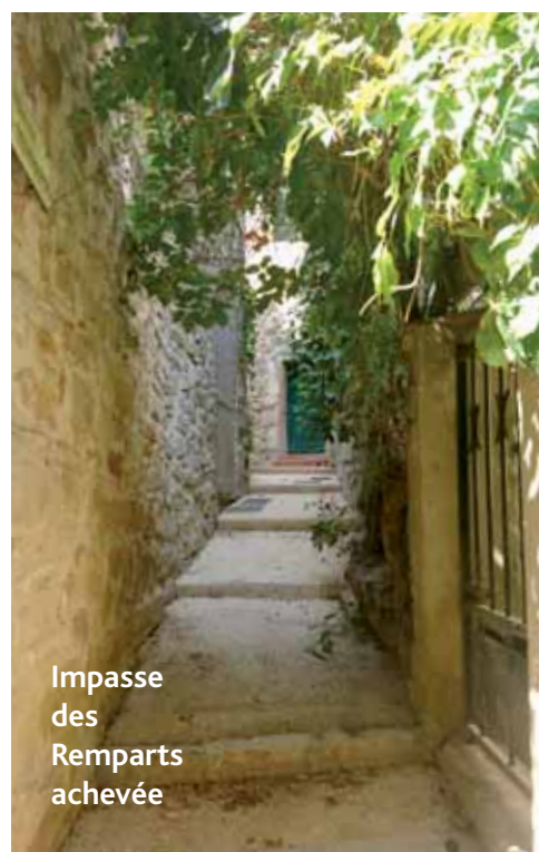
Impasse des Remparts achevée