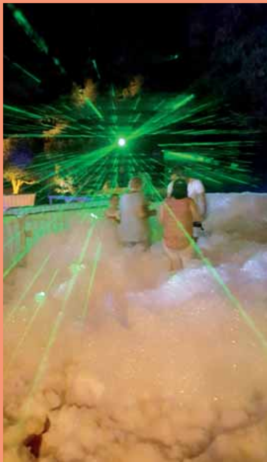
Détente et bonne humeur lors de la soirée mousse

Le soir venu, musiques et pailletes étaient de rigueur lors des spectacles et concerts le vendredi, samedi et lundi, tandis que le dimanche, le parking des écoles s'est transformé en boîte de nuit à ciel ouvert pour une soirée mousse des plus festive.