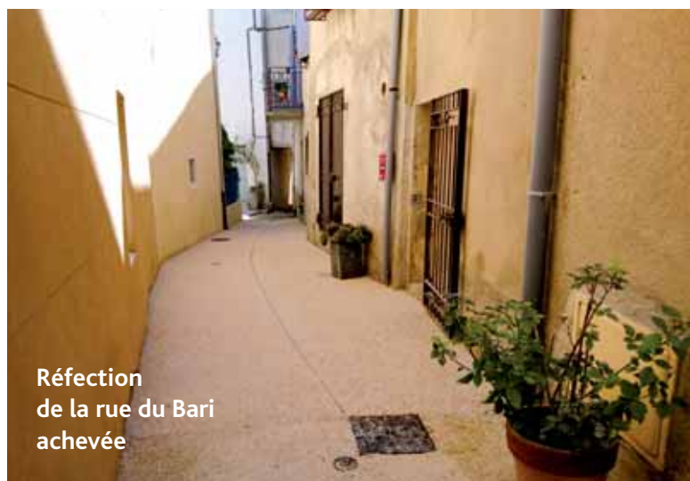
Réfection de la rue du Bari achevée