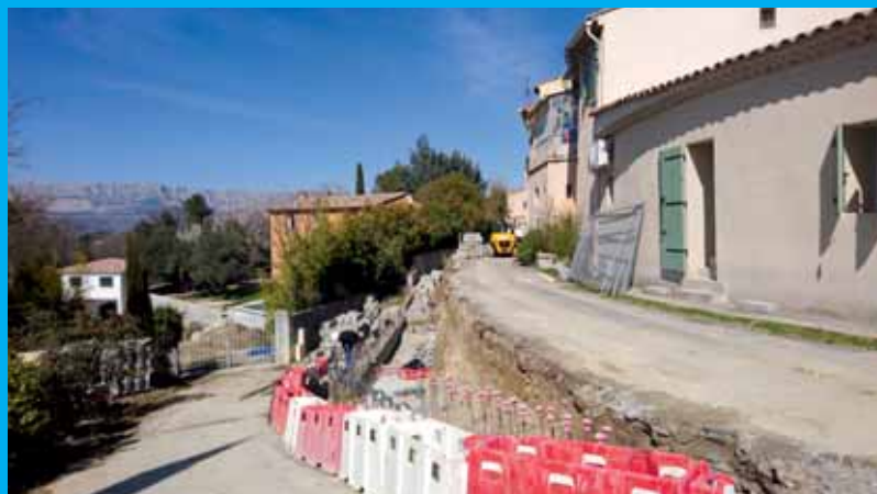
Création d'un mur de soutènement à la Rue du Jaillet