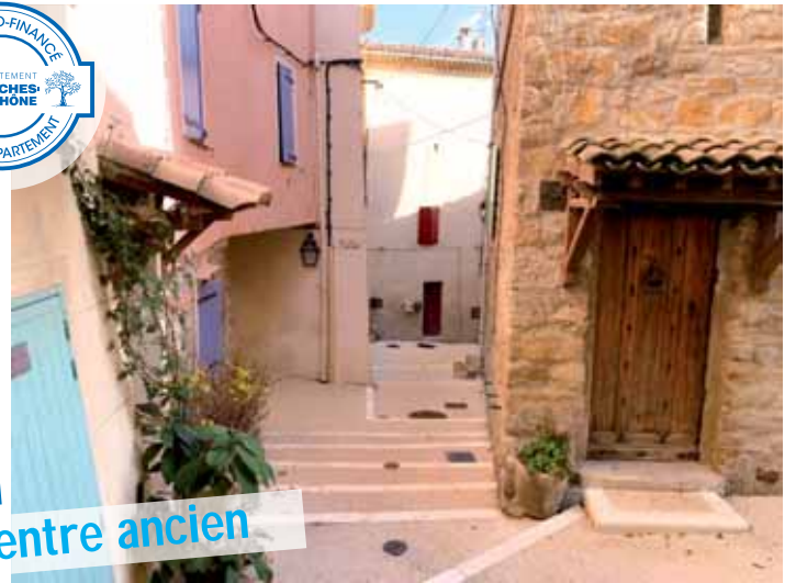
Un escalier rénové, rue du Bari