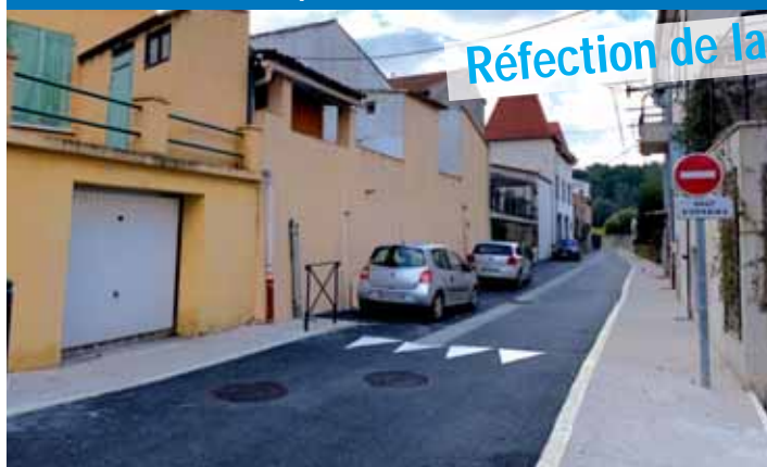
Réfection de la rue du Jaillet