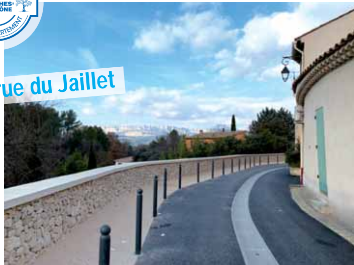
Construction d'un mur de soutènement