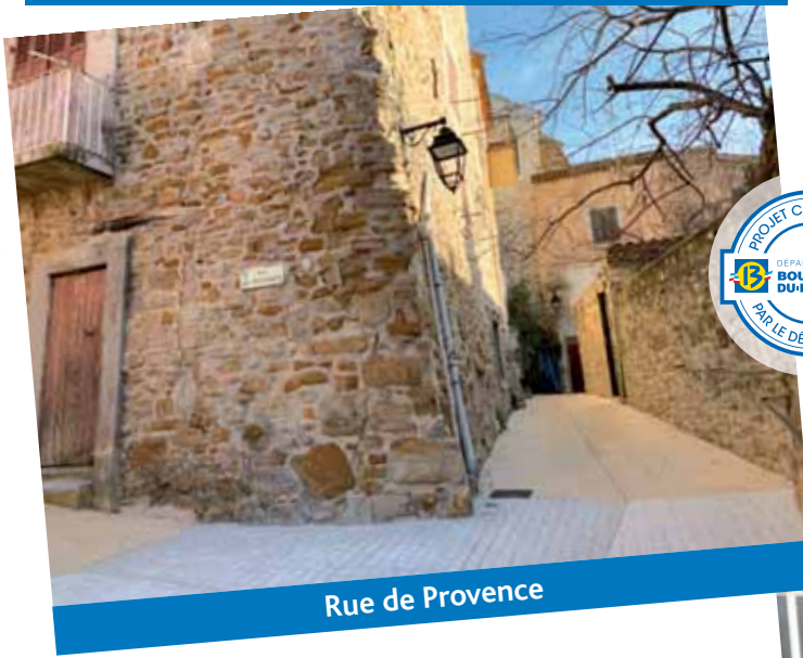
Rue de Provence