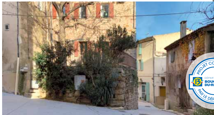
Place de l'Eglise