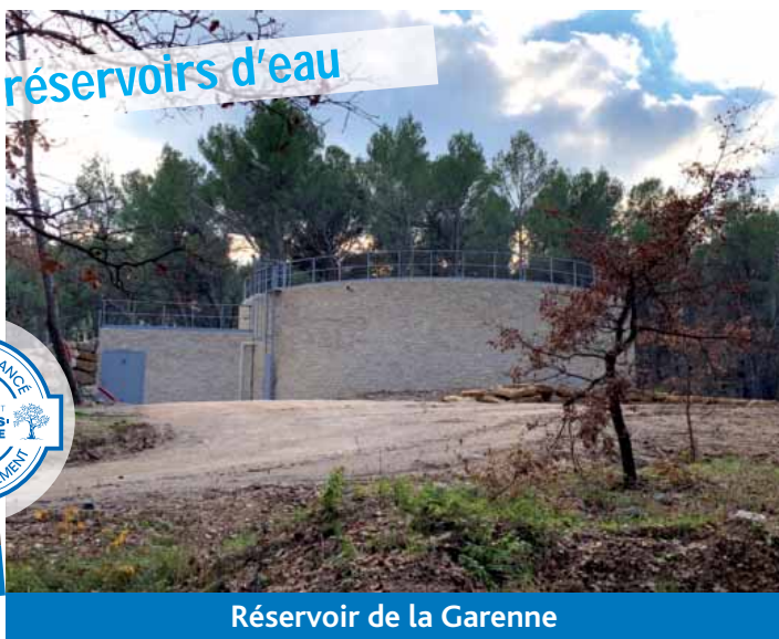
Réservoir de la Garenne