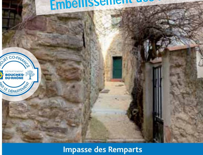
Impasse des Remparts