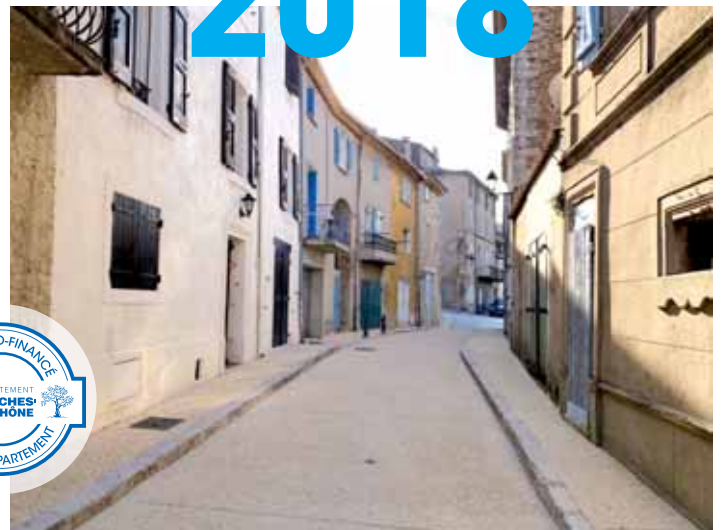
Rue des Ormeaux