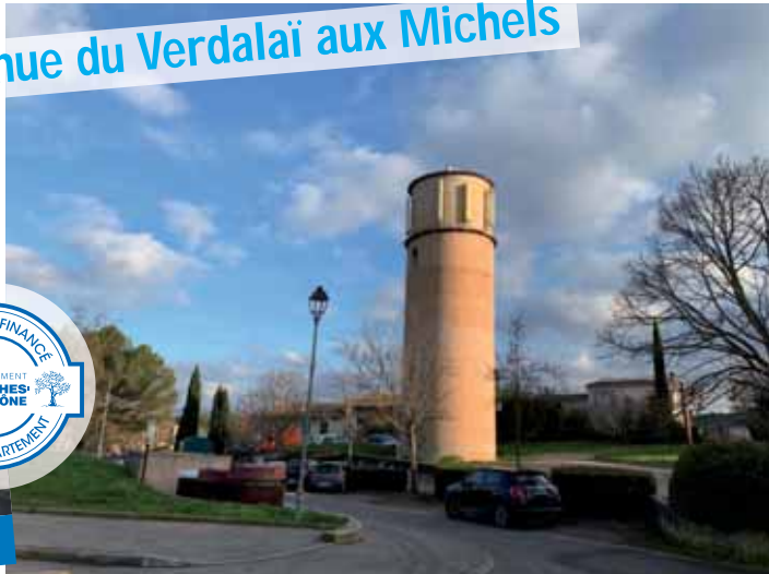
Réfection de la voirie aux Michels

Aménagement des trottoirs, enfouissement et réfection des réseaux, remplacement du revêtement de la chaussée, la réfection totale de la voirie de l'avenue du Verdalaï embellit le hameau des Michels.