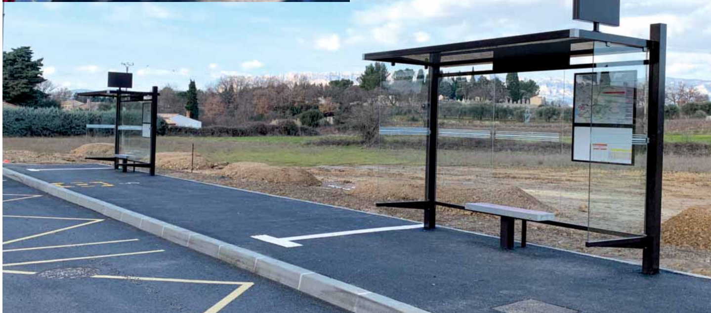
Travaux d'aménagement de l'arrêt de bus du Lavoir

L'arrêt du Lavoir est aujourd'hui en service et répond totalement à l'attente, à la fois, des utilisateurs et du délégataire.