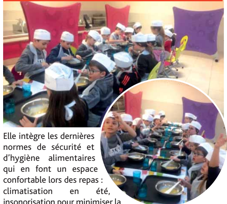
Atelier cuisine au nouveau restaurant

Elle intègre les dernières normes de sécurité et d'hygiène alimentaires qui en font un espace confortable lors des repas : climatisation en été, insonorisation pour minimiser la fatigue due aux nuisances acoustiques,... Grâce à cette nouvelle réalisation, la production de repas pourra être portée à 400 par jour, pérennisant l'efficacité de la cantine pour les années à venir. La construction de ce nouvel équipement municipal a été subventionnée à 60% par le Conseil Départemental des Bouches-du-Rhône et 20% par la Métropole, le reste étant à la charge de la Commune. Une cérémonie sera prochainement organisée pour son inauguration officielle.