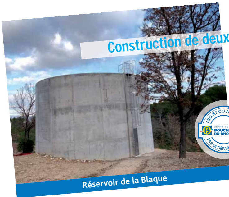
Réservoir de la Blaque