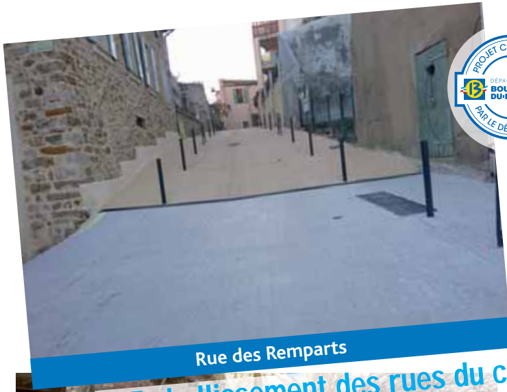
Rue des Remparts