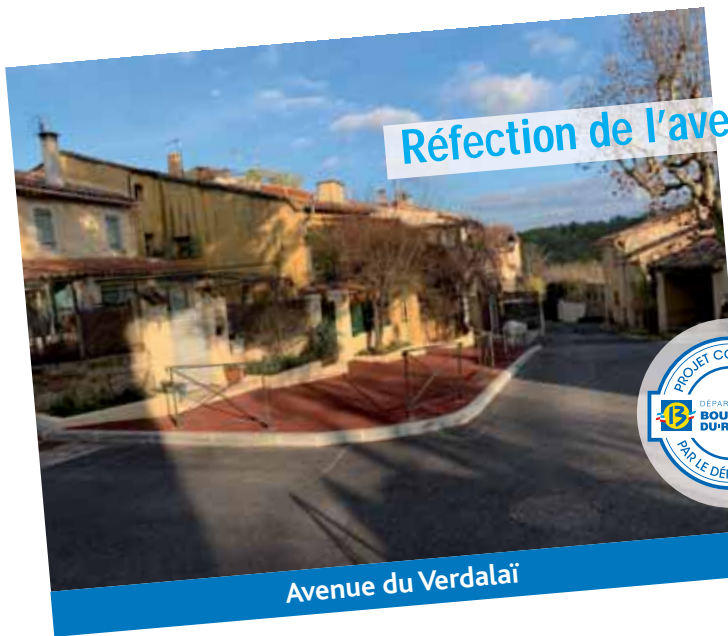
Réfection de l'avenue du Verdalaï aux Michels