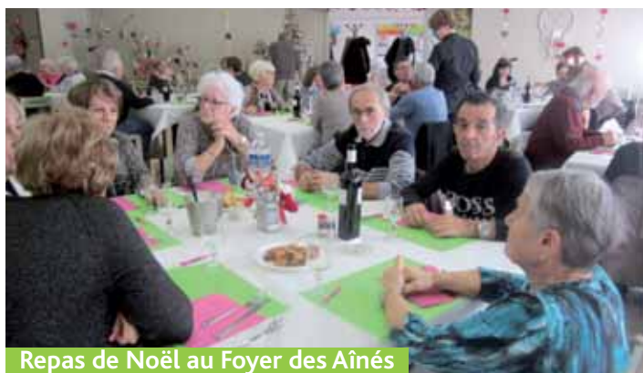
Repas de Noël au Foyer des Aînés

La liste est non exhaustive. Chacun est libre de soumettre de nouvelles activités. Si cela est possible, elle pourra être mise en place.