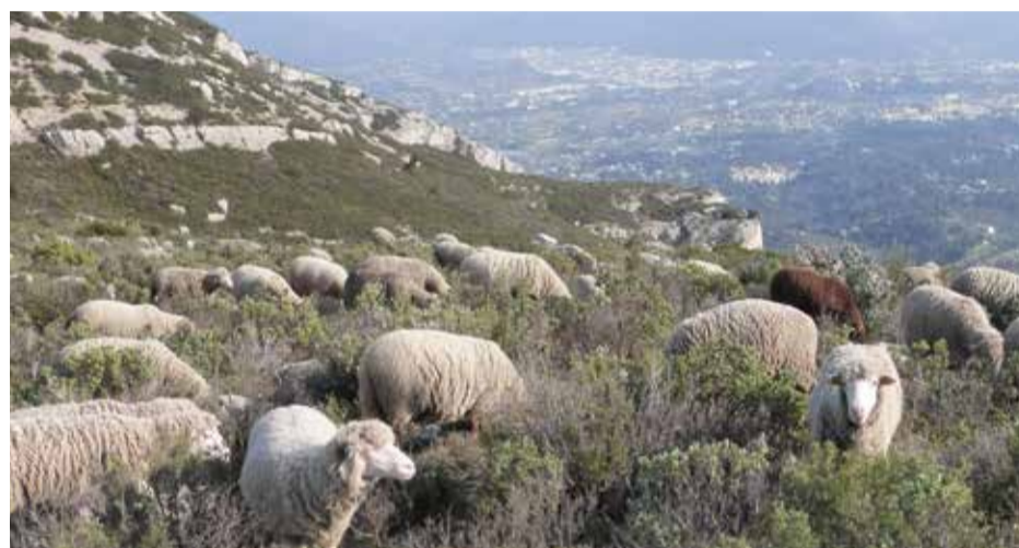
Le pastoralisme en forêt participe à l'entretien des forêts