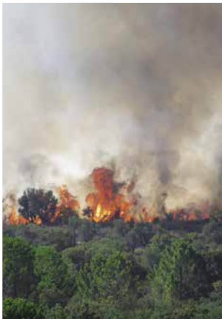
Départ de feu en bord de route