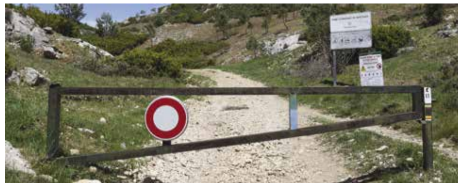
Barrière d'accès aux pistes DFCI