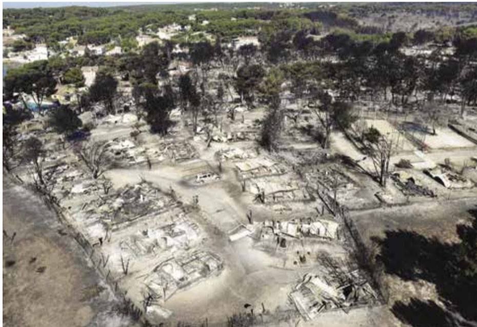
Incendie en forêt